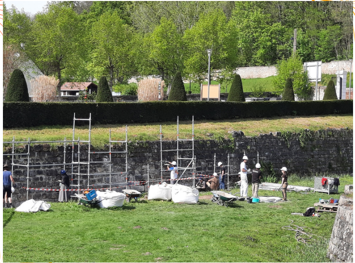
Restauration de la contrescarpe.

Les travaux sur la tour Henri IV devraient reprendre début mai après obtention de l'autorisation de travaux pour la fondation spéciale de l'escalier et les demandes de subventions correspondantes.