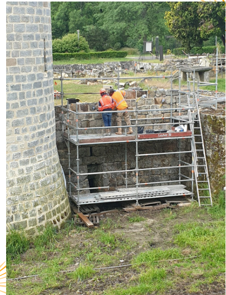
Travaux sur les remparts

Nous vous souhaitons de bonnes vacances.